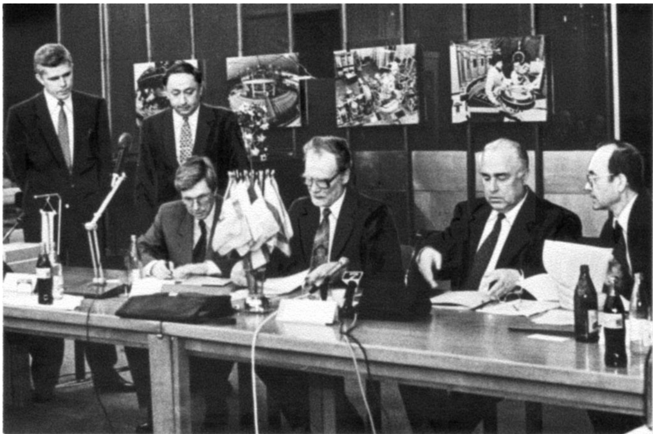
Визит премьер-министра России В.С. Черномырдина. Подписание Соглашения между правительством РФ и ОИЯИ. Дубна, 23 октября 1995.