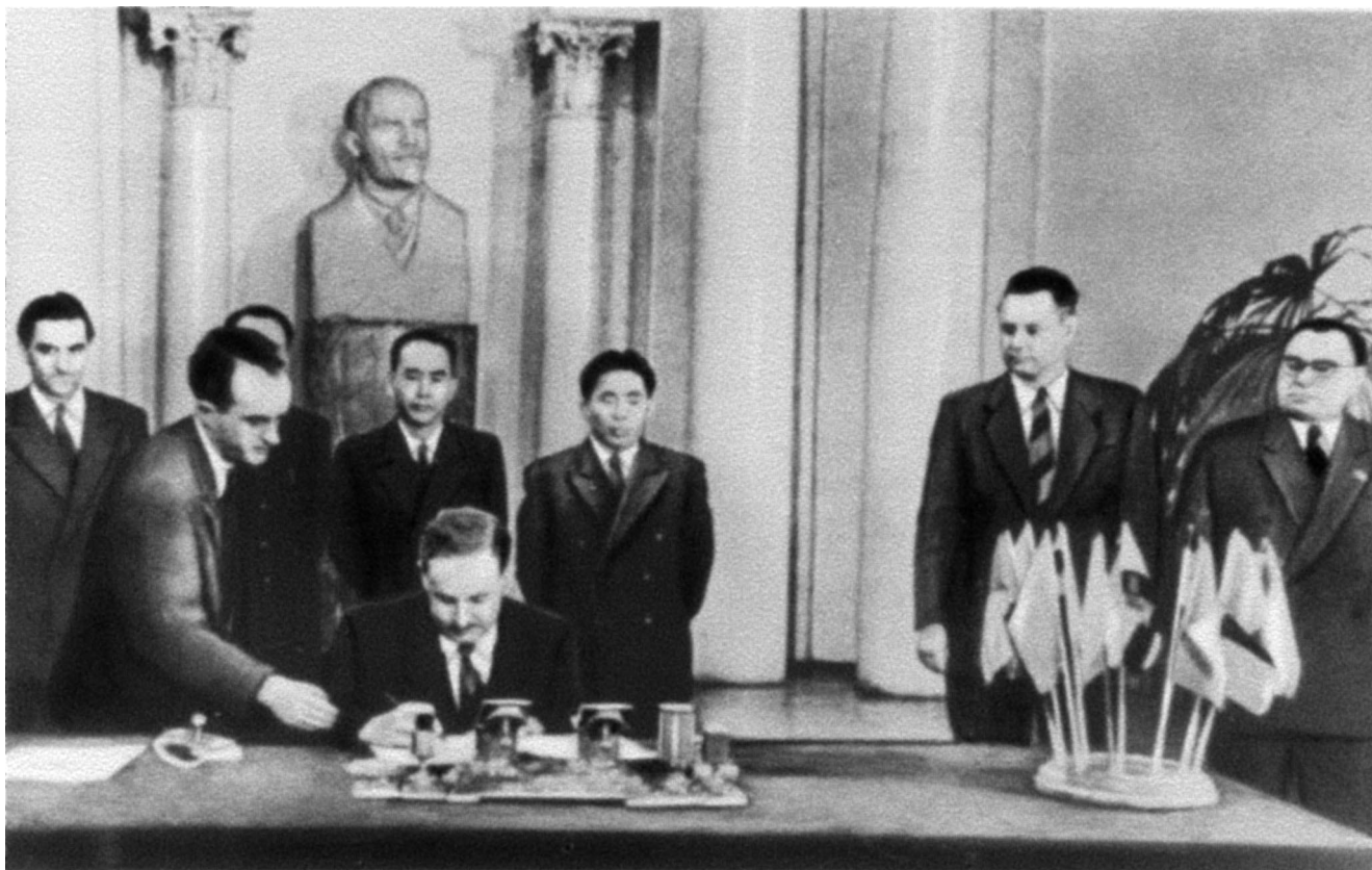
Подписание Соглашения об организации Объединенного института ядерных исследований. Москва, 26 марта 1956 г.

ничать друг с другом. Появились совместные эксперименты, совместные публикации, совместные конференции и школы для молодых ученых. Это сотрудничество всегда развивалось по восходящей линии. Сейчас ОИЯИ активно участвует в проекте большого адронного коллайдера, реализуемого в ЦЕРНе. Этот проект рассчитан на десятилетия.