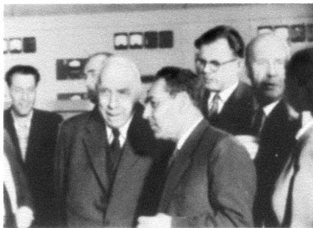
Гость ОИЯИ — выдающийся ученый Нильс Бор. Дубна, 1961 г.

Дубна располагает уникальными в своем классе ускорителями заряженных частиц и ядер в широком диапазоне энергий. Помимо синхроциклотрона и синхрофазотрона, в лабораториях Института действуют ускорители тяжелых ионов У-200 и У-400; в 1993 г. получен пучок ионов, выведенный из нового циклотрона У-400М; в 1993–1994 гг. введен в действие сверхпроводящий ускоритель релятивистских ядер — нуклотрон.