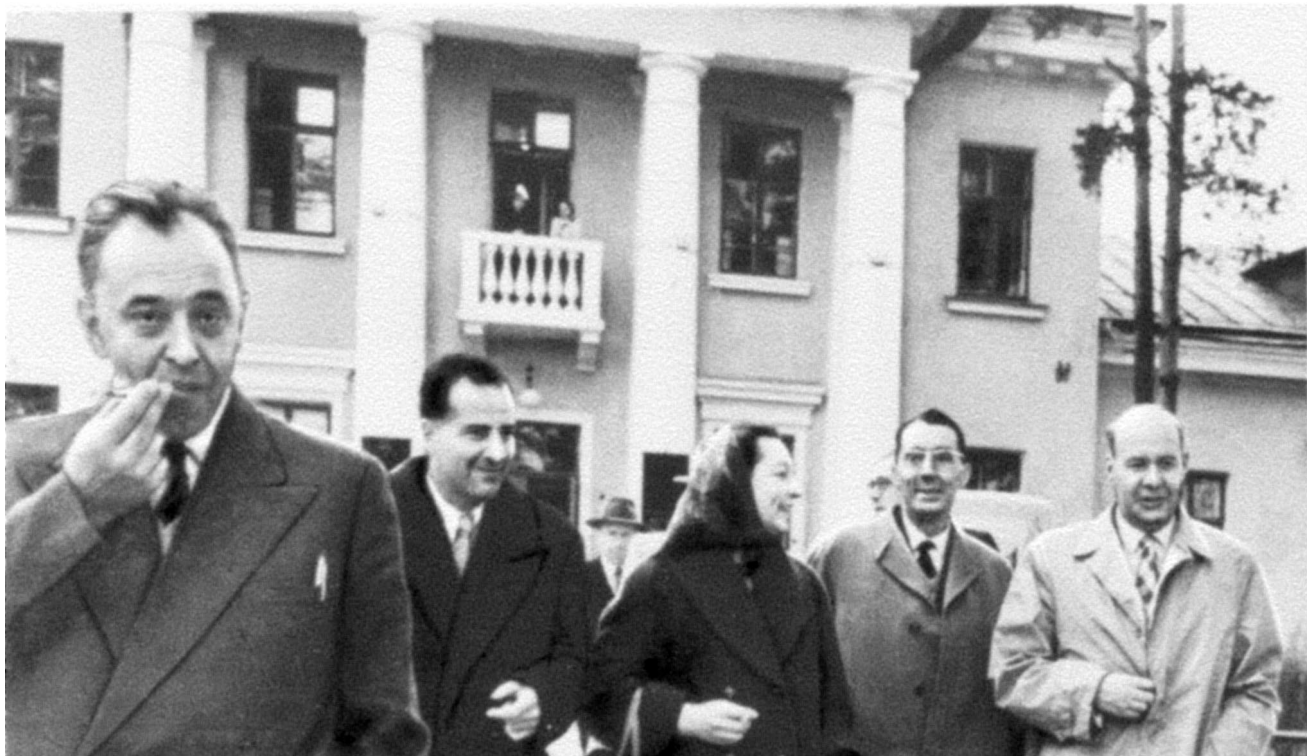
В 1958 г. ОИЯИ посетил всемирно известный физик и общественный деятель Фредерик Жолио-Кюри. На снимке: М. Даныш, Б. Понтекорво, Ж. Лаберриг, Ф. Жолио-Кюри, Д.И. Блохинцев.