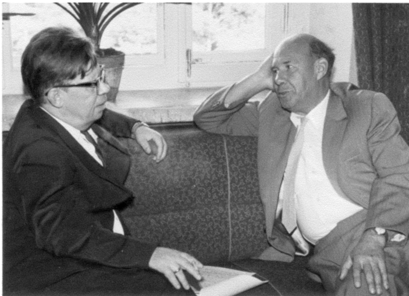
Н.Н. Боголюбов и первый директор ОИЯИ Д.И. Блохинцев. Дубна, 1963 г.

слером, Б.М. Понтекорво, Г.Н. Флеровым, И.М. Франком, плодотворно работающие все эти десятилетия.