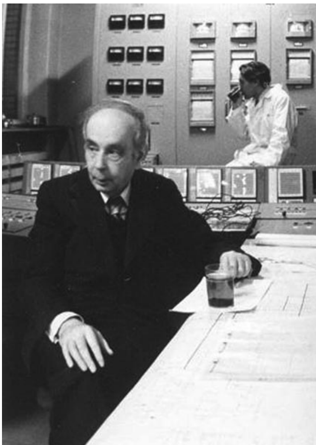
И.М. Франк у пульта управления реактора ИБР-2.

В 1969 г. начинается строительство этого очень сложного, уникального объекта. Создание ИБР-2 проходит при определяющей помощи Минсредмаша: это и ресурсы, и новые технологии, инженерная, интеллектуальная поддержка его отраслевыми институтами. В координации этих работ велика роль И.М. Франка.