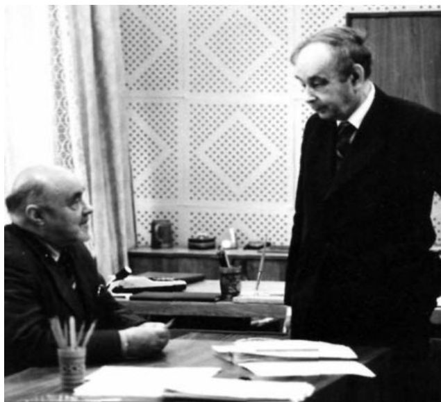
И.М. Франк (справа) и Н.А. Доллежал

Реактор ИБР-2. С 1966 г. И.М. Франка и Д.И. Блохинцева охватывает идея создания мощного импульсного реактора ИБР-2. Предпосылками к этому были повышенный интерес в мировом научном сообществе к источникам нейтронов, как стационарным, так и импульсным, успешный опыт эксплуатации ИБР и необходимость увеличения плотности потока нейтронов на выведенных пучках. Идея получает поддержку в ОИЯИ и в правительстве СССР. При активном участии И.М. Франка начинаются проектные и опытно-конструкторские работы по созданию ИБР-2. Главный конструктор — Н.А. Доллежал (НИКИЭТ), научный руководитель проекта — Д.И. Блохинцев (1967–1979 гг.), а с 1979 г. — И.М. Франк. В ЛНФ по инициативе И.М. Франка создаётся отдел, в задачи которого входят научное руководство и курирование работ ИБР-2.