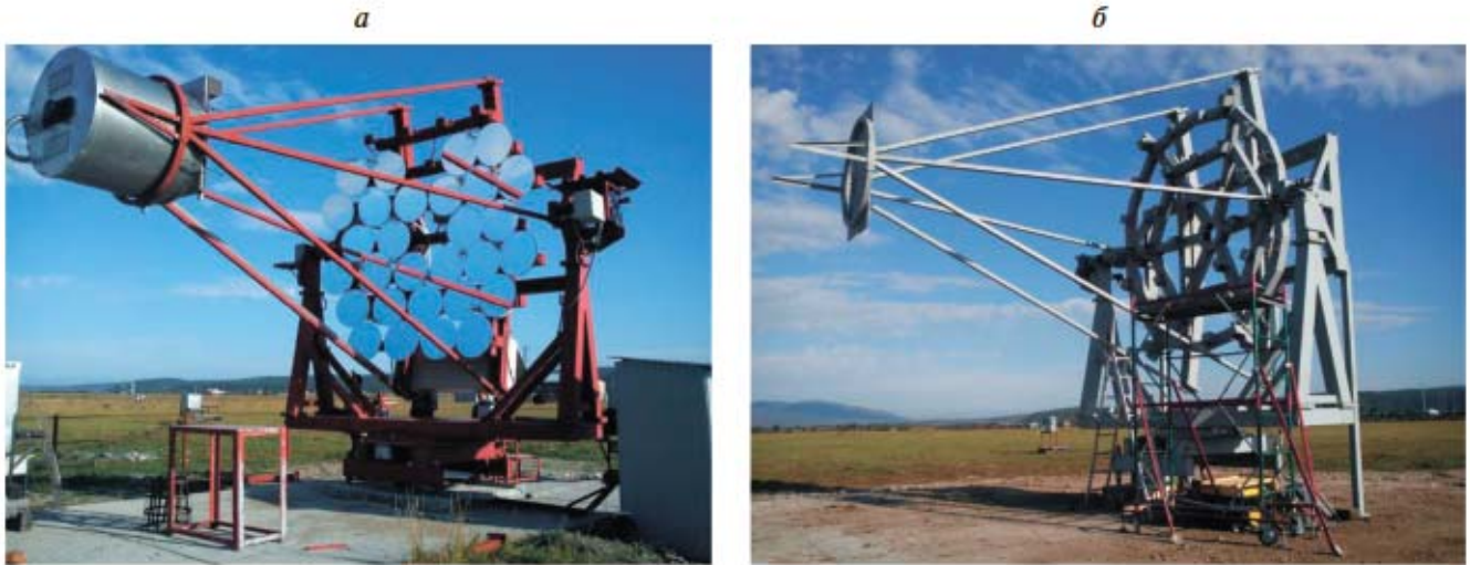
Рис. 2. Первый (а) и второй (б) телескопы IACT (сентябрь 2018 г.).

контролируемым образом нагревают в печи в течение 48 ч. Стекло деформируется и принимает сферическую форму под действием силы тяжести. Специальный режим изменения температуры позволяет достичь достаточно гладкой поверхности. Текущие эксперименты направлены на повышение гладкости конечного продукта, чтобы избежать последующей полировки стекла и минимизировать ошибки кривизны до пределов, допустимых для TAIGA–IACT, чтобы диаметр фокального пятна не превышал 3 мм. Для этого предложен переход от выпуклой поверхности формы к вогнутой. При этом поверхность будущего зеркала вообще не соприкасается с поверхностью формы. Качество стеклянных заготовок (однородность по толщине составляет около 0.02 мм на диаметре 600 мм) позволяет предполагать, что моллированные поверхности зеркал позволят минимизировать дальнейшую обработку.