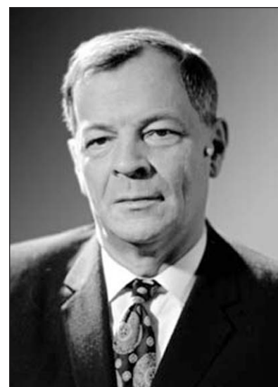
Лев Андреевич Арцимович.

При рассмотрении приходивших на его имя приглашений прямых отказов не бывало.