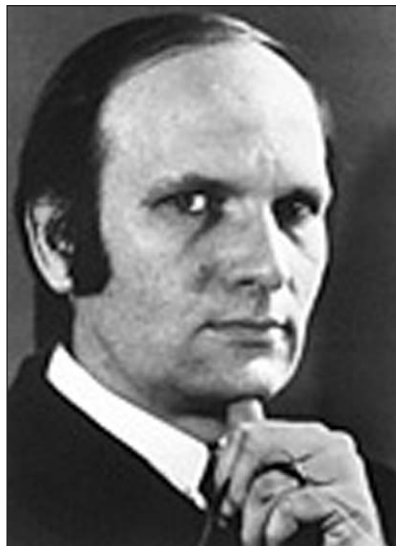
Джон Роберт Шриффер.