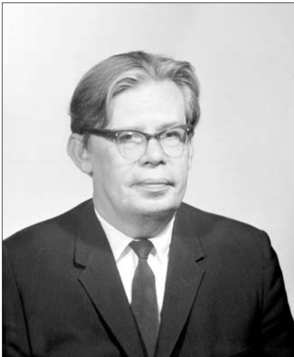
Николай Николаевич Боголюбов.

второстепенные места. Потому краткая заметка мало кому известного автора [3], в которой тот убедительно суммировал теоретические предпосылки для такого объединения, была воспринята в научном мире как сенсация. Среди тех, кого увлекла перспектива наконец-то найти управу на проблему сверхпроводимости, не подававшуюся до того строгому осмыслению, был и Боголюбов.