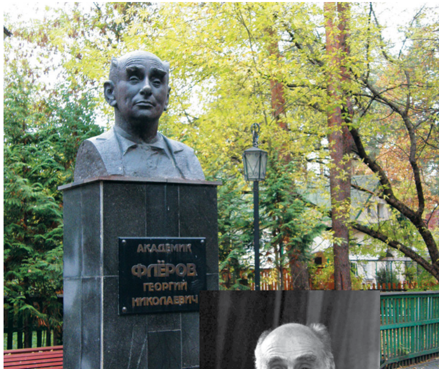
Георгий Николаевич Флёров

Почётный гражданин города. Именем Г.Н. Флёрова названа Лаборатория ядерных реакций и улица. В Дубне ему установлен памятник. Его имя носит 114-й элемент таблицы Д.И. Менделеева.