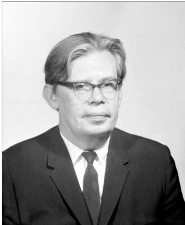
Николай Николаевич Боголюбов.

второстепенные места. Потому краткая заметка мало кому известного автора [3], в которой тот убедительно суммировал теоретические предпосылки для такого объединения, была воспринята в научном мире как сенсация. Среди тех, кого увлекла перспектива наконец-то найти управу на проблему сверхпроводимости, не подававшуюся до того строгому осмыслению, был и Боголюбов.