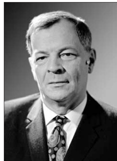
Лев Андреевич Арцимович.

При рассмотрении приходивших на его имя приглашений прямых отказов не бывало.